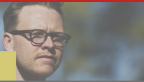
Markus Gabriel el professor de filosofia alemany més jove des de Schelling; neorealista